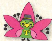
開校90周年キャラクター 「トミッピー」

新宿区立富久小学校は、令和2年度に開校90周年を迎えました。昨年の11月13日には、記念式典を挙行了しました。密を避けるため、会場には5、6年生のみ、1年生から4年生はオンラインでの参加となりました。「ありがとう みんなのおかげで90周年 未来へつ