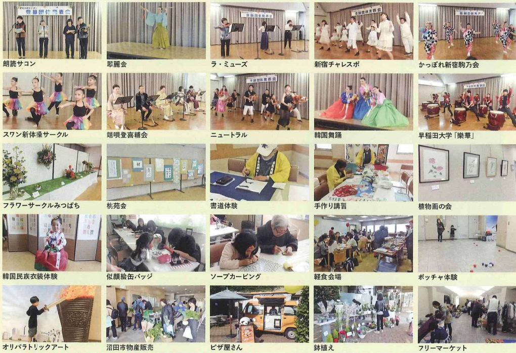
朗読サロン 翠麗会 ラ・ミュージック 新宿チャレスボ かっぱれ新宿駒乃会 スワン新体操サークル 端唄登喜輔会 ニュートラル 韓国舞踊 早稲田大学「楽華」 フラワーサークルみつばち 桃苑会 書道体験 手作り講習 植物画の会 韓国民族衣装体験 似顔絵缶バッジ ソープカービング 軽食会場 ポッチャ体験 オリパラトリックアート 沼田市物産販売 ピザ屋さん 鉢植え フリーマーケット