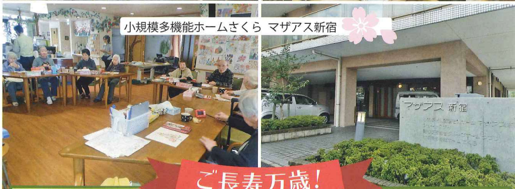
小規模多機能ホームさくら マザアス新宿