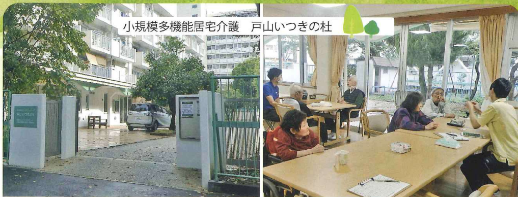
小規模多機能居宅介護 戸山いつきの杜