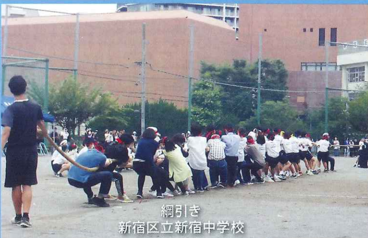
綱引き 新宿区立新宿中学校