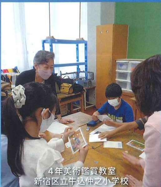
4年美術鑑賞教室 新宿区立牛込仲之小学校