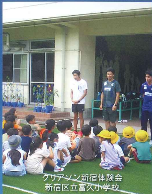
クリアソン新宿体験会 新宿区立富久小学校