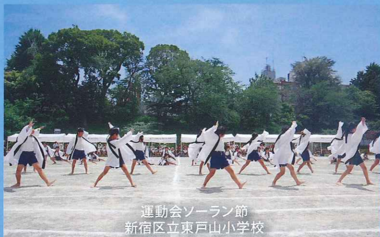
運動会ソーラン節 新宿区立東戸山小学校