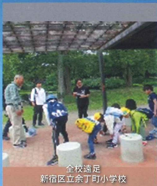
全校遠足 新宿区立余丁町小学校